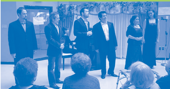
Chanteurs et chanteuses de l'Opéra de Montréal venus faire une visite au C.H. de Saint-Henri

Nul besoin de dire que leur visite a été grandement appréciée des résidents qui ont pu vivre un beau moment tout en musique.