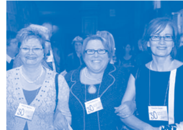
Quelques fêtes s'amusant lors de la soirée