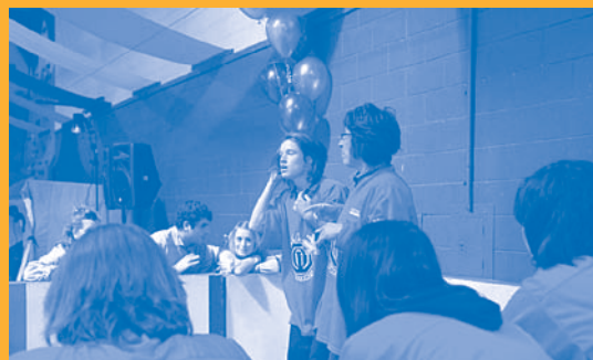
Improvisation par la L.I.P.S.I.L., composée d'employés du CSSS

À tous les nominés : encore merci pour votre engagement et votre grand dévouement. Vous vous impliquez pleinement, tous les jours, dans votre travail et cela se remarque!