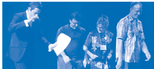
Le concours de moonwalk en aura fait rire plusieurs.