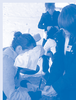
Nombreux ont été les participants à profiter du kiosque de massages sur chaises